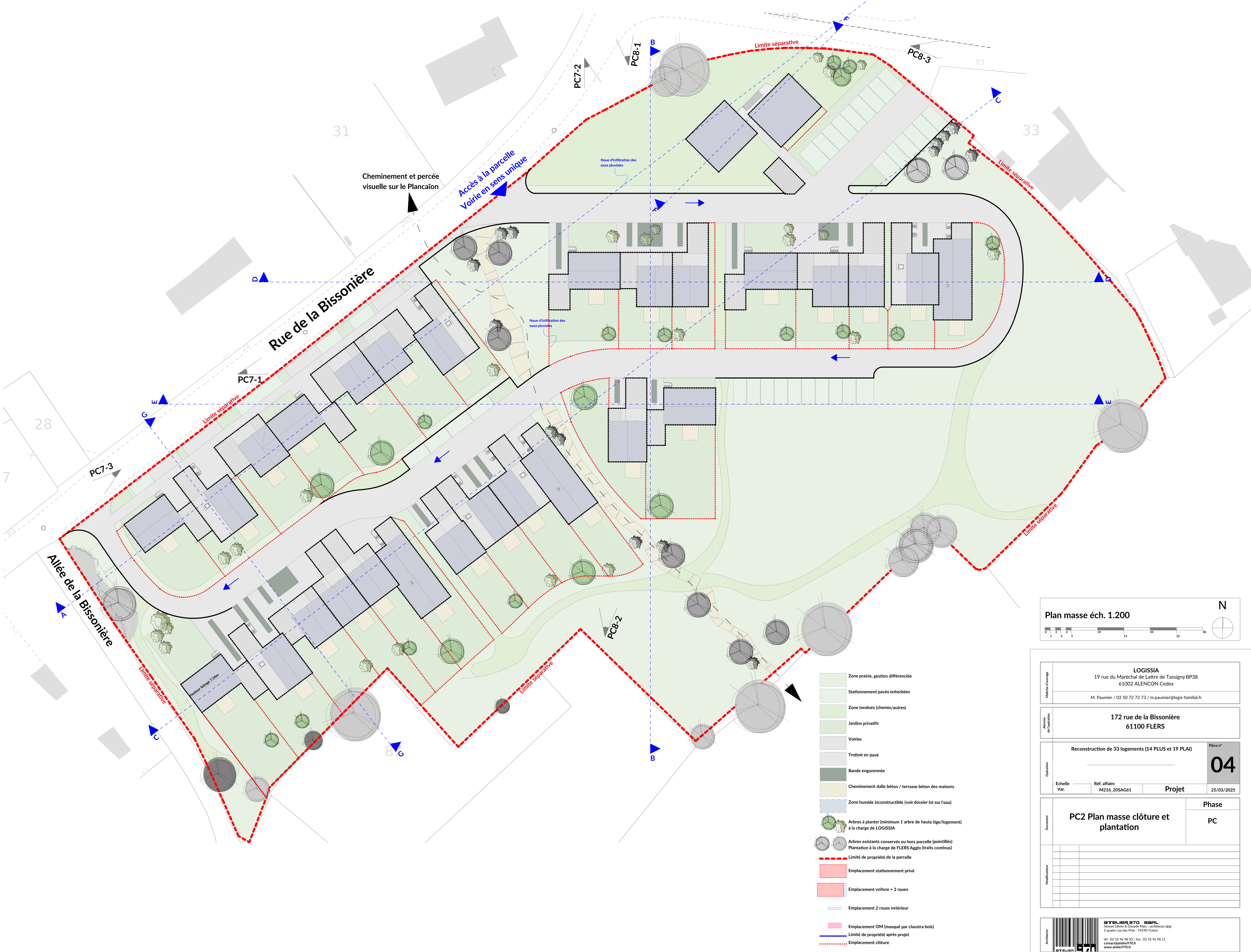
Plan masse éch. 1.200